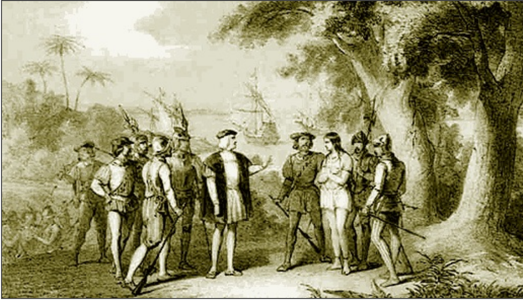
Grabado titulado Reconocimiento de la isla española por Cristóbal Colón, del libro de José Ferrer de Couto "Historia de la Marina Real Española" (1854).

El Hospital Universitario 12 de Octubre es